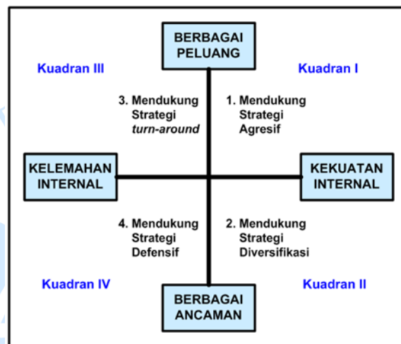
Gambar 4. Analisis SWOT

serta merancang strategi untuk mengatasi masalah tersebut secara lebih efektif. Strategi tersebut di dapatkan dari posisi perusahaan yang akan di tentukan oleh perhitungan IFAS dan EFAS. Berikut merupakan posisi kuadran SWOT yang dapat di lihat di Gambar 4