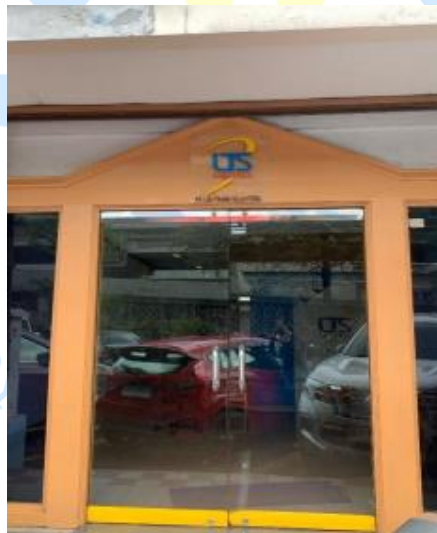
Gambar 1 PT Lini Trans Sejahtera Jakarta

Penelitian dilaksanakan di PT Lini Trans Sejahtera Jakarta yang merupakan perusahaan yang bergerak di bidang jasa logistik dan freight forwarding . PT Lini Trans Sejahtera Jakarta merupakan kantor cabang perusahaan yang pusatnya berada di Denpasar. Kehadiran perusahaan di cabang Jakarta ini dapat memperkuat jaringan distribusi perusahaan dan memungkinkan layanan logistik menjangkau lebih banyak pelanggan secara cepat dan efisien. Adapun gambar lokasi penelitian dapat dilihat pada gambar 1.