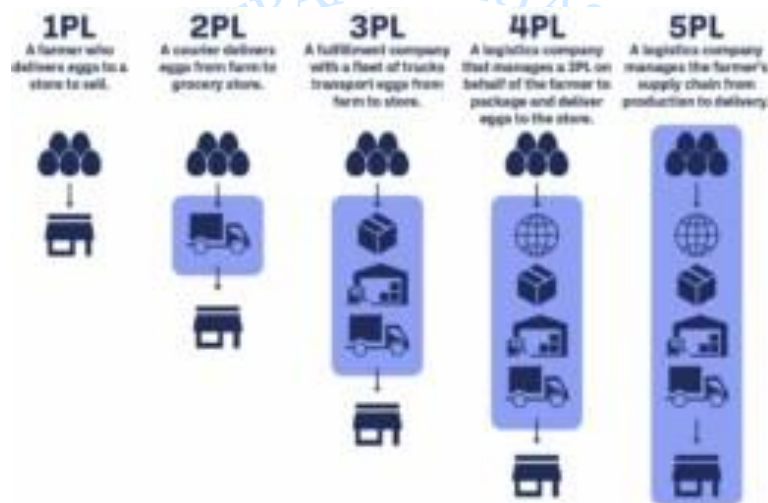
Gambar 3 Gambar Jenis Layanan Logistik

Layanan logistik berkembang dalam beberapa tingkatan, dai 1PL hingga 5PL, masing-masing dengan fungsi dan tingkat kompleksitas yang berbeda seperti pada gambar 3.